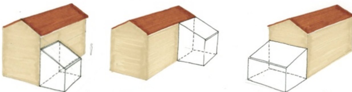
Illustration à titre d'exemple de cas possibles :

Les toitures à un seul pan sont interdites, sauf dans le cas d'un volume accolé par sa plus grande hauteur à la construction principale et dans la limite d'une emprise au sol inférieure à 50 m 2 .