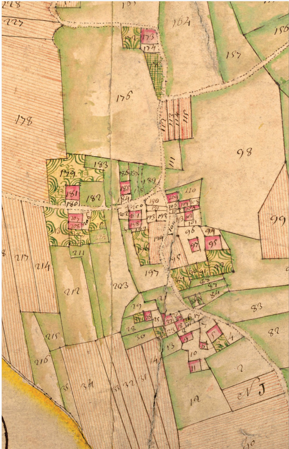
Doc 1 : Extrait de la mappe sarde