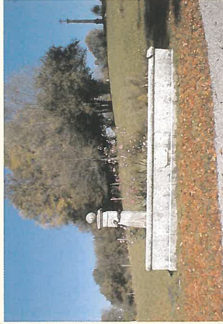
Bassin en granit "hameau du Péryl"