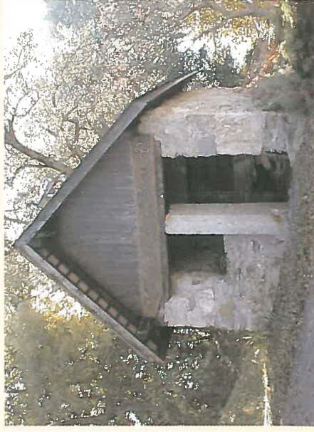
Un four à pain "hameau du Péryl"