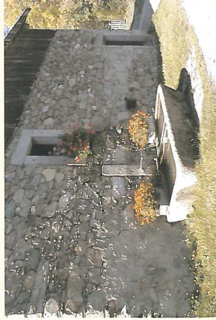
"hameau du Péryl"